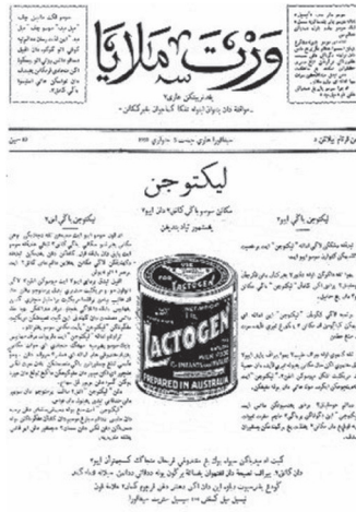
Muka Depan Akhbar Warta Malaya