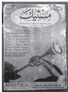
Muka depan majalah Mastika

Sewaktu bekerja di Utusan Melayu , Rahim Kajai kehilangan banyak keistimewaan sepertimana yang diberikan oleh Warta Melayu . Beliau menerima gaji yang kecil tanpa kemudahan rumah. Rahim Kajai terpaksa menyewa rumah di Sian Lin Park, Singapura. Kesanggupan Rahim Kajai ini dianggap sebagai pengorbanan beliau dalam memperjuangkan kepentingan bangsa Melayu. Beliau mempelbagaikan bentuk pengisian akhbar sesuai dengan selera pembaca. Secara beransur-ansur akhbar Utusan Melayu mendapat sokongan masyarakat. Menjelang bulan November 1939 akhbar mingguan Utusan Zaman diterbitkan dengan kandungan yang menarik perhatian pembaca berupa rencana, cerpen dan puisi. Majalah Mastika merupakan majalah pertama yang diterbitkan oleh Utusan pada 1 Jun 1941 dengan Rahim Kajai sebagai pengarang. Majalah ini dalam tulisan jawi memuatkan pelbagai artikel dan cerpen. 21 Rahim Kajai adalah perintis dalam bidang penulisan cerpen sebelum Perang Dunia Kedua yang kemudiannya menjadi popular dalam kalangan penulis Melayu.