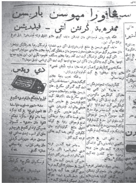
Contoh akhbar Saudara

Sewaktu berada bersama akhbar Saudara , penulisan Rahim Kajai adalah dalam soal agama dan masyarakat. Beliau yang terlalu menumpukan perhatian dalam penulisan mengenai hukum Sunnah dan ibadah, talkin, talfaz dan bahניה menyebabkan terdapat pembaca yang mengkritik Rahim Kajai yang dianggap membuang masa dan masih dalam pemikiran lama. 12 Walaupun dikritik, Rahim Kajai berpegang kepada prinsip bahawa sebarang apapun yang dilakukan di dunia mestilah berpegang kepada peraturan atau hukum agama Islam. Bagaimanapun, Saudara kemudiannya memainkan peranan penting memberikan fokus kepada isu kemajuan dan perusahaan yang diceburi oleh orang Melayu.