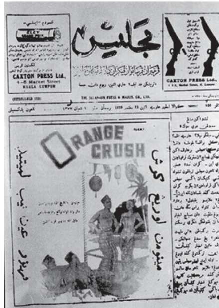
Muka Depan Akhbar Majlis