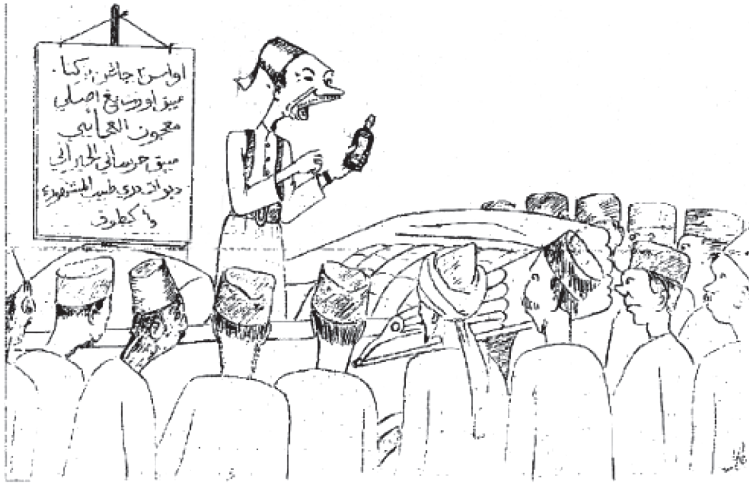
Karikatur: Wak Ketok menjual ubat ajabi, Utusan Zaman , 28 Januari 1940

Ada juga pendapat yang mengaitkan Wak Ketok watak yang mewakili kehidupan orang Melayu di bandar sekitar 1930an. 32 Wak Ketok sebuah watak komik dengan berpakaian orang Jawa iaitu blangkon, capal dan kain sarung. Ada kalanya Wak Ketok berpakaian ala Arab atau Jawi Peranakan. Karikatur Wak Ketok akan diiringi dengan artikel yang mengulas isu tertentu mewakili orang Melayu.