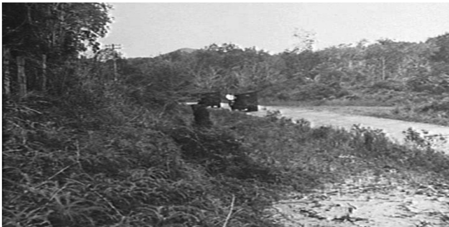
Gambar: Jalan Mersing Berhampiran Ladang Nithsdale.