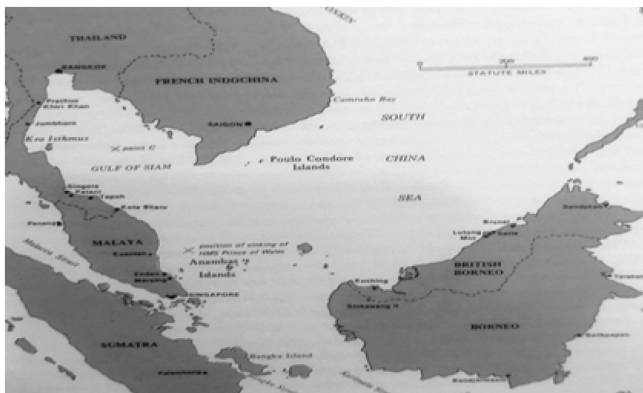
Peta: Kedudukan Endau-Mersing

Sumber: Paul S. Dull, A Battle History of the Imperial Japanese Navy 1941-1945 , Maryland: United States Naval Institute Press, 1978, hlm. 37.